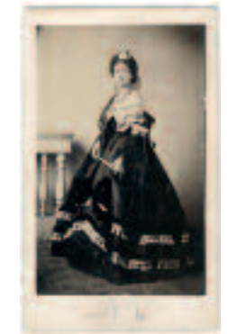
Fotografien aus der Ausstellung Truhe auf Wanderschaft, JMS

Pour tout renseignement: www.comsira.ch e-mail: cultur@comsira.ch ou secretgen@comsira.ch tél: 022 317 89 00 ou 022 317 89 30